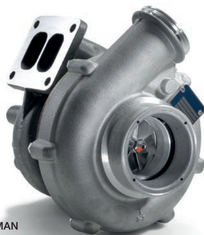
Оригинальные турбокомпрессоры MAN от 66 960 руб.